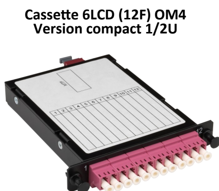
Cassette 6LCD (12F) OM4 Version compact 1/2U