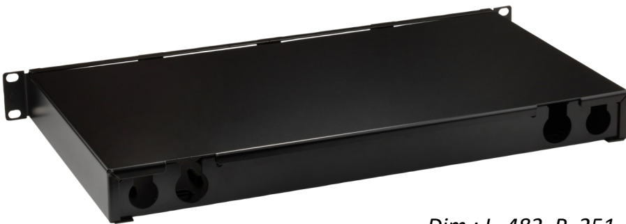
Dim : L. 482, P. 251, H. 44 mm Poids : 3 kg—Couleur: Noir (RAL 9005)